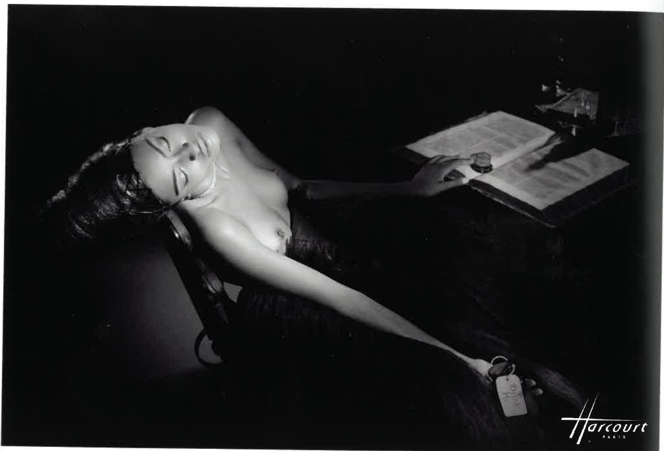
Jupe David's Road chez Springsioux.