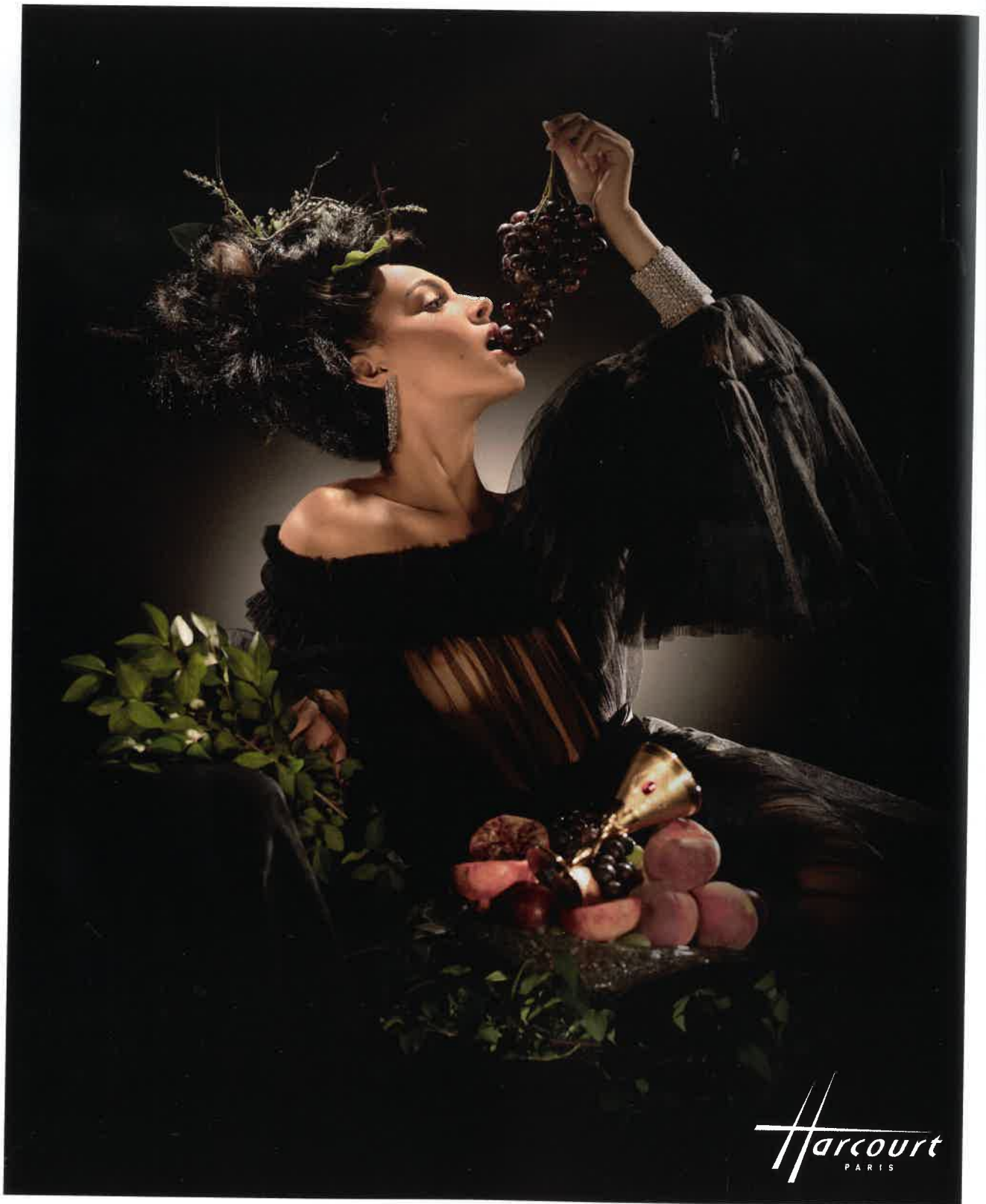
Manchettes et boucles d'oreilles Burma, Robe David's Road chez Springsioux Page précédente : Jupe David's Road chez Springsioux.