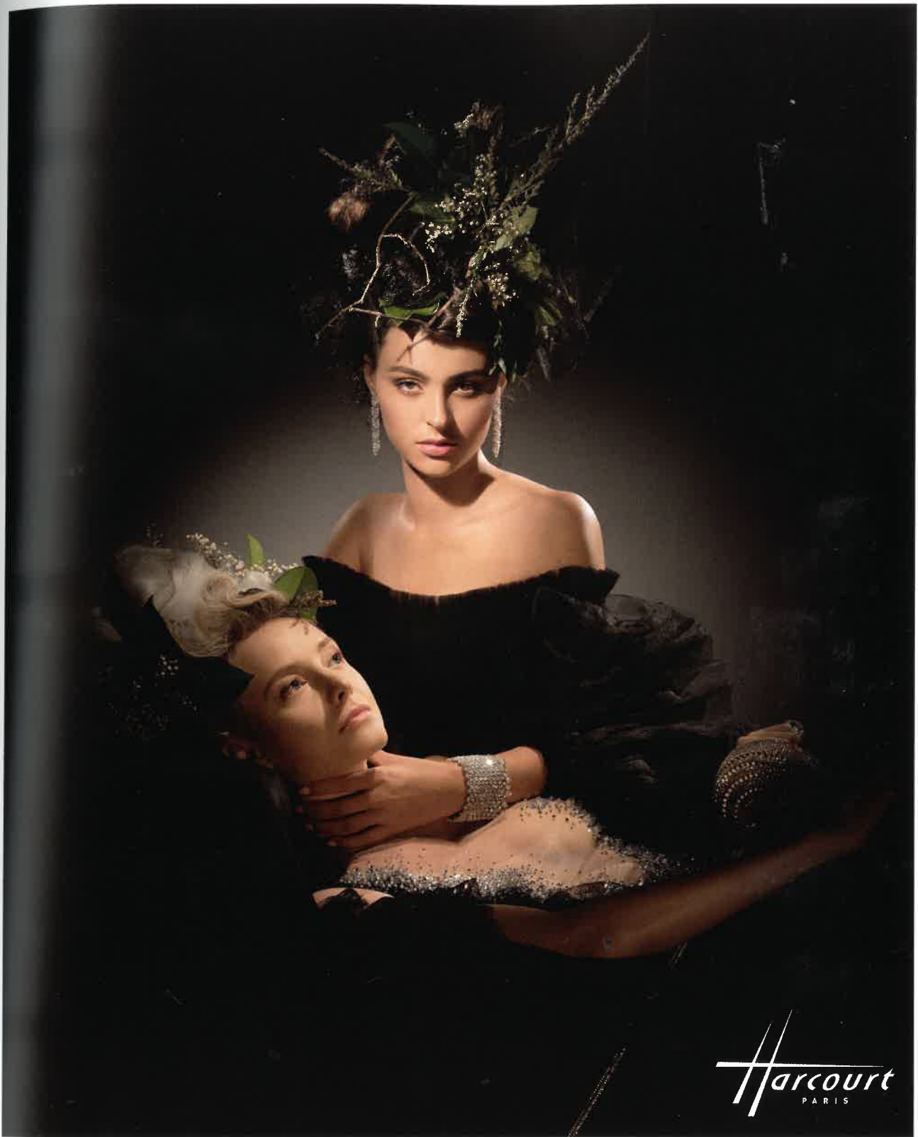
Robe Maison On Aura Tout Vu, Deuxième plan : Robe David's Road chez Springsioux Manchette et boucles d'oreilles Burma