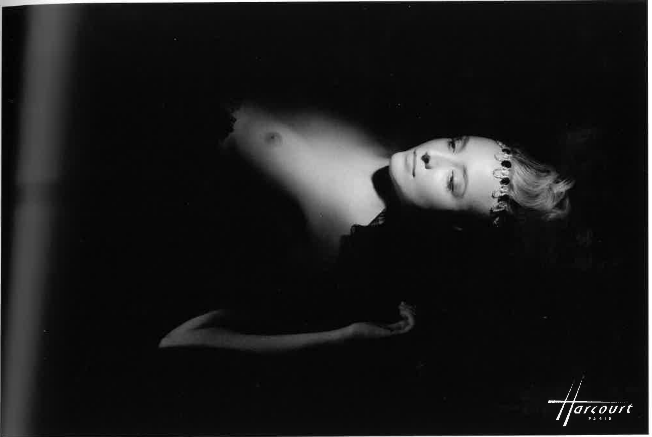
Jupe David's Road chez Springsioux, Porté en couronne, collier Burma